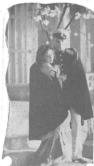
Michiko Tanaka och Pierre Richard-Willm