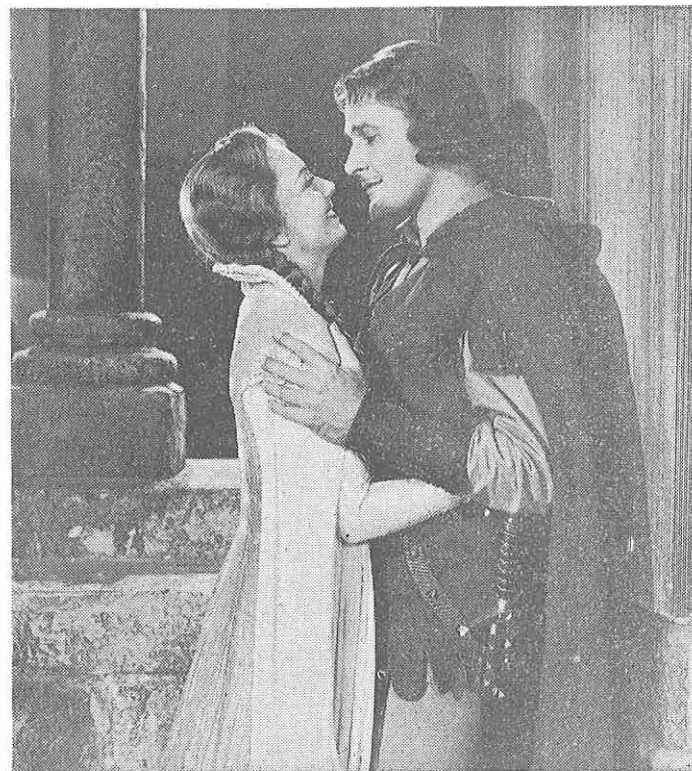
Olivia de Havilland och Errol Flynn göra huvudrollerna 11