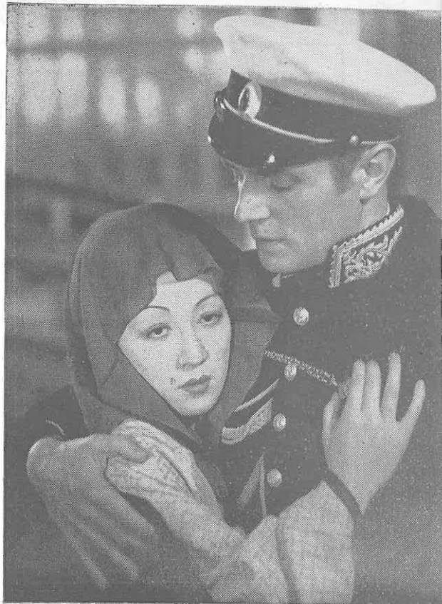
Pierre Richard-Willm och Michiko Tanaka i YOSHIWARA. Denna vecka på Rialto och Rival